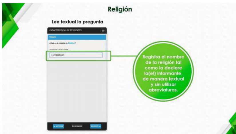
Imagen 3.

Se dieron varios ejemplos de respuestas que pudieran ser dichas por el informante. En esas opciones se colocó Católico en primer orden, lo que ya se demostró que genera registros extra, sin embargo, apareció en un listado y no como único ejemplo. Se buscó precisar al encuestador sobre lo que se pretende conocer en esa pregunta y las posibles respuestas consideradas como imprecisas, para indagar a mayor profundidad y registrar la respuesta de religión del censo. En otras ocasiones, ampliaron, que es al encuestador a quien no le parecen conocidas las respuestas pero se trata de datos registrables. Sin embargo, se especifica al encuestador: “Considera también que la (el) informante puede no tener, profesar o seguir alguna religión o creencia religiosa y declarar: ‘no tengo religión’, ‘ninguna’, ‘ateo’, ‘sin religión’, entre otras. En estos casos, recuerda nuevamente registrar textualmente lo que te declare la persona informante” (INEGI, 2020 a : 270). Acto seguido, se reafirma al trabajador del INEGI que no debe realizar discriminación alguna con motivo de religión y se agrega: “ten presente que la premisa, de acuerdo a la neutralidad propia de un censo, es registrar la religión con carácter laico, sin establecer preferencias, no calificar o discriminar ninguna creencia, de manera que se registran textualmente todas las declaraciones vertidas por las (os) informantes” (INEGI, 2020 a : 270).