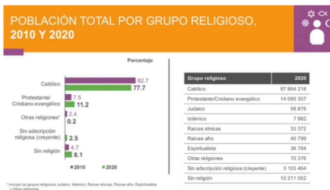
Imagen 1. Fuente: INEGI, Censo de población y vivienda 2020.

Cuando INEGI publicó los datos del Censo 2020, utilizó tablas como la de la imagen 1. Otro aspecto a destacar es la disminución de la variable Otras religiones, en 2.2%. Sin embargo, es lógico con respecto a los movimientos de información que implicó organizar la información de evangélicos y protestantes en una categoría ya que en otros censos aparece en varias. Esta última afirmación ya la expuse parcialmente con anterioridad (López Delgadillo, 2021). Está demostrado que hay una proporción de mexicanos que históricamente se inclinan a autoadcribirse como Sin religión. Es una dinámica que al graficarse tiene una tendencia de crecimiento positiva. Esta dinámica histórica de crecimiento también se identifica con los evangélicos.